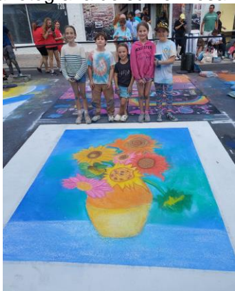
Girasoles de Van Gogh